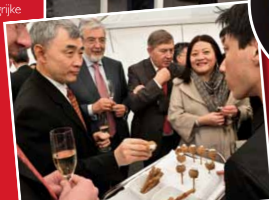
De receptie met allerlei lekkernijen van het varken