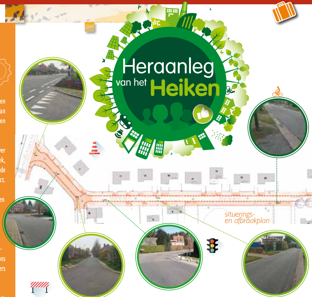
situerings- en afbraakplan

Op 7 maart 2016 stelden we samen met de gemeente een eerste ontwerp van de heraanleg van het Heiken voor aan de buurtbewoners van Kalmthout tijdens een infovergadering.